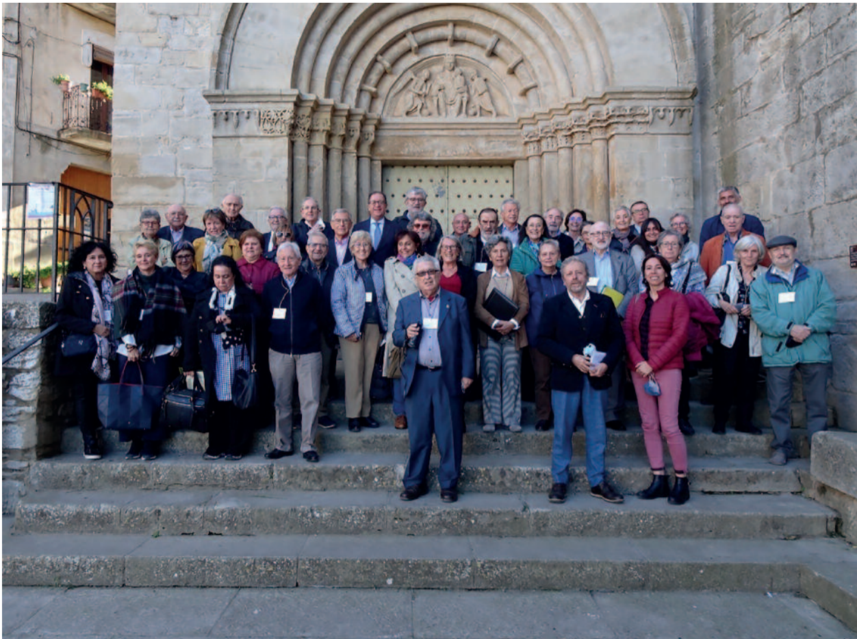
Fotografia de grup dels participants a la portalada de l'església del Monestir de Santa Maria de Vallbona

La propera edició, doncs, està prevista per a l'any 2023 i en serà la XVIena. Tota la informació es comunicarà a través del web de la Societat ( www.schf.cat ).