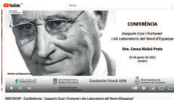
Captures de pantalla de la retransmissió de la sessió