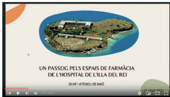
Xerrada. Un passeig pels espais de farmàcia de l'Hospital de l'Illa del Rei. M a Gràcia Seguí Puntas