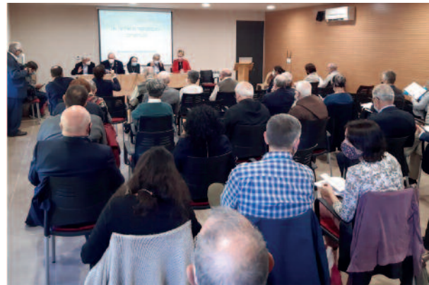
Sala d'actes del Centre de Recursos de Vallbona de les Monges, on han tingut lloc les sessions.