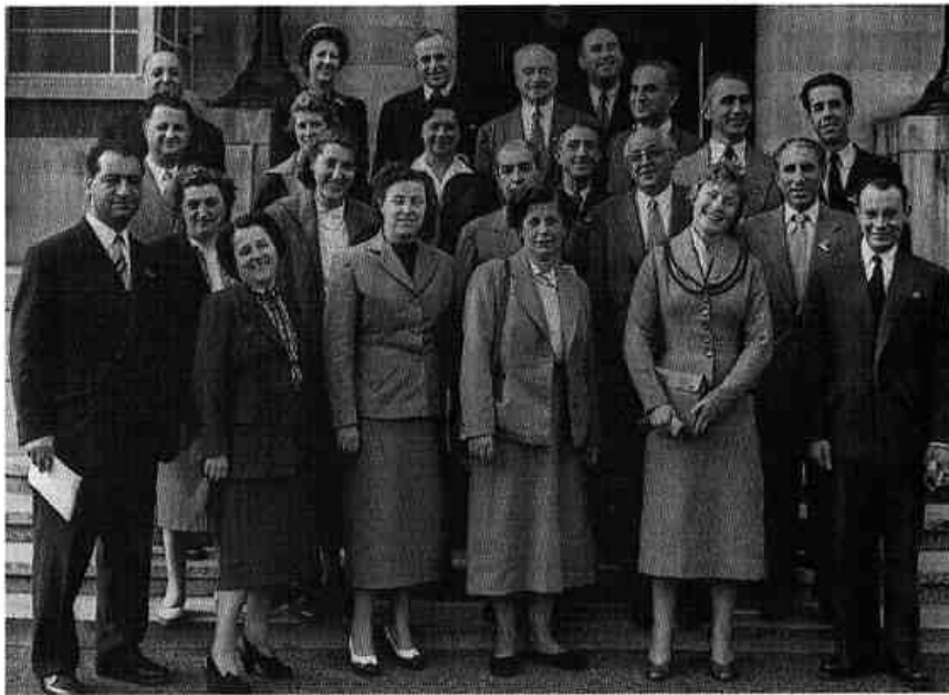
Delegació a Londres el 1955

demanar-li una fotografia adient. No tenim còpia d'aquella carta, ni cap esborrany que pogués indicar-nos en quins termes es dirigeix a Turrientes i què és el que li diu.